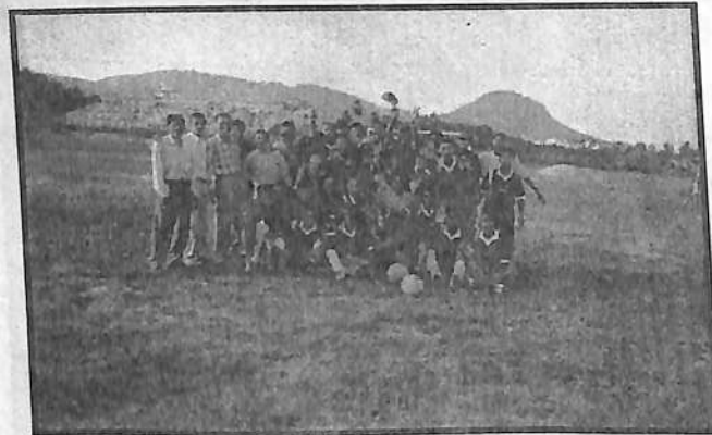
Our College Football Team after being champion in the Inter College Football competition (Greater Guwahati) organised by I.I.T.G.