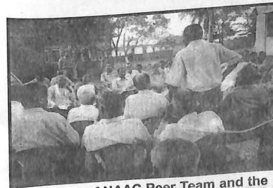
Members of NAAC Peer Team and the Well Wishers of the College in the Exit Meeting on 9.9.04