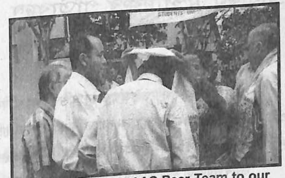
Welcoming the NAAC Peer Team to our College on 8.9.04