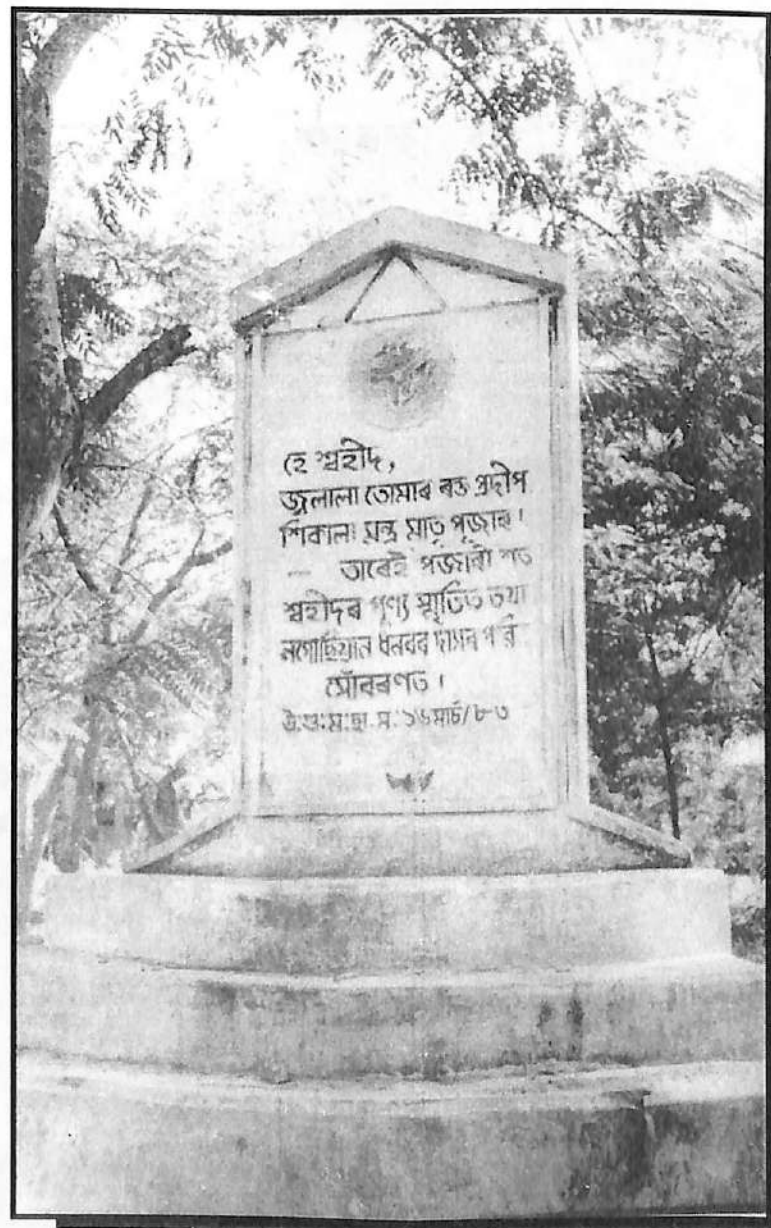
স্বদেশ আৰু স্বজাতিৰ হকে আত্মবলিদান দিয়া মহান স্বহীদ সৰ্বলৈ আমাৰ আন্তৰিক শ্ৰদ্ধাঞ্জলি জ্ঞাপন কৰিলো।